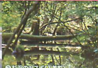
②杉沢の沢スギ(入善町)