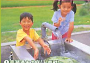
①高瀬湧水の庭(入善町)