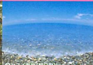
③ヒスイ海岸(朝日町)