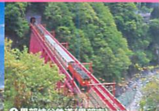
④黒部峡谷鉄道(黒部市)