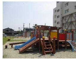
ぬくもりのある木製遊具