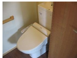
ウォッシュレット機能付