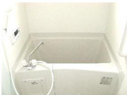
追炊き式ユニットバス