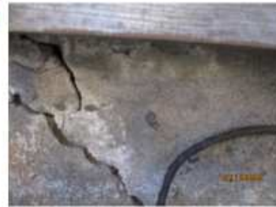
現状基礎ひび割れ 地盤の締固め状況が良くない