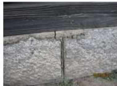
玉石基礎状況 ずれている部分が多い