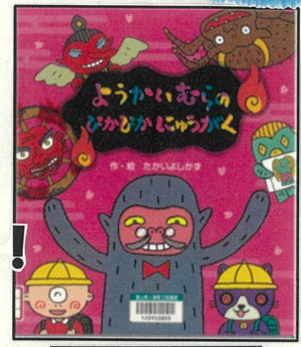
ようかいおらのびかひかにゅうがく (たかいよしかず 作・絵、国土社)