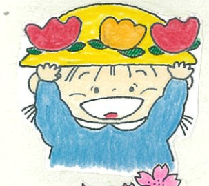
ぞうくんはいちねんせい (ながしまひろみ 作、アリス館)