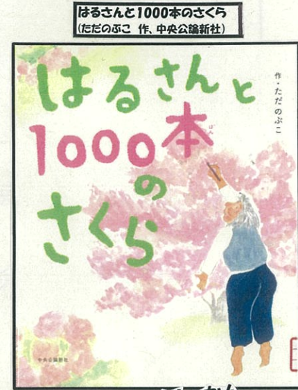
はるさんと1000本のさくら (きたのだよこ 作、中央公論新社)