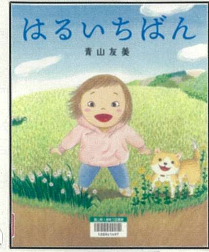
はるいちばん (青山友美 作、講談社)

みなさん!! ... おめでとうございます。 春は、あたらしい生活や、お友だち など、わくわく楽しいことがいっぱい すね!! ... 3月と4月は、としよ館でも春の絵本 をたくさんそろえて、みなさん をおまちしています。ぜひ あそびにきてね!!