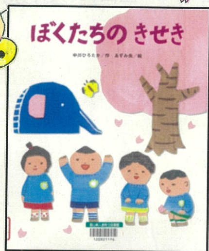
ぼくたちのきせき (中川ひろたか 作、あずみ虫 絵、錦木出版)