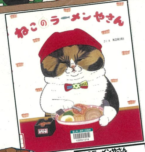
ねこのラーメンやさん (KORIRI さくえ、金の星社)