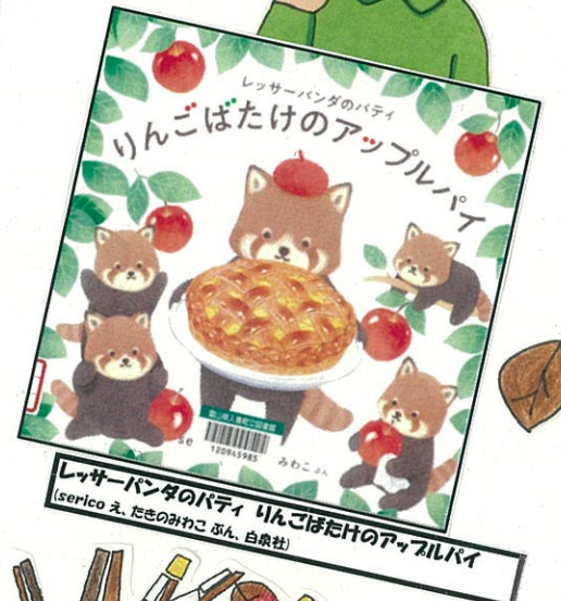
いんごばたけのアップルパイ (しろこ、あかね社)