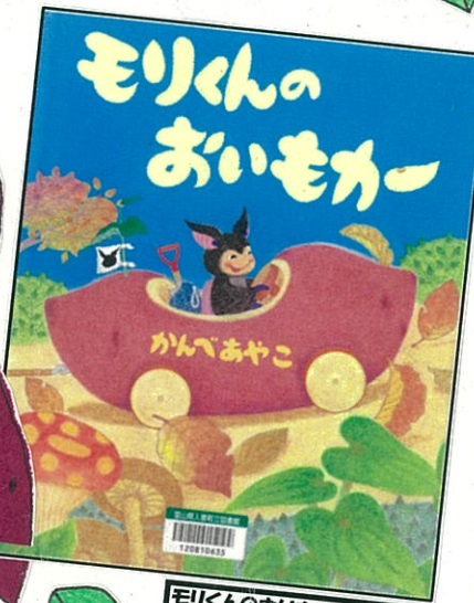
モリくんのおいもカー (かんべあやこ、くもん出版)