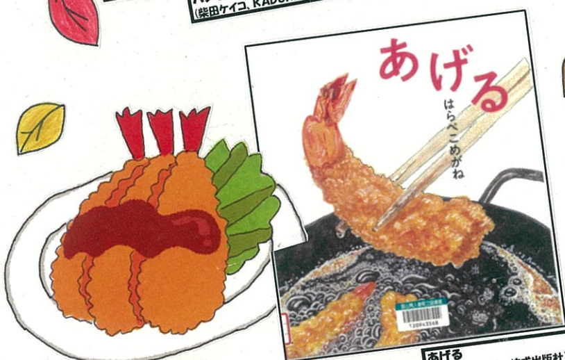
あげる (ほんまけい、佼成出版社)