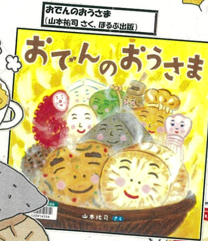
おでんのおうさま (山本祐司 さく、ほるぷ出版)