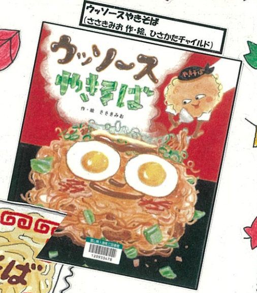
ウソッス やきそば (ささきみゆ 作・絵、ひさかたチャイルド)