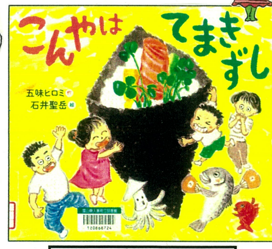
こんやは てまぎずし (五味ヒロミ 作、石井聖岳 絵、岩崎書店)