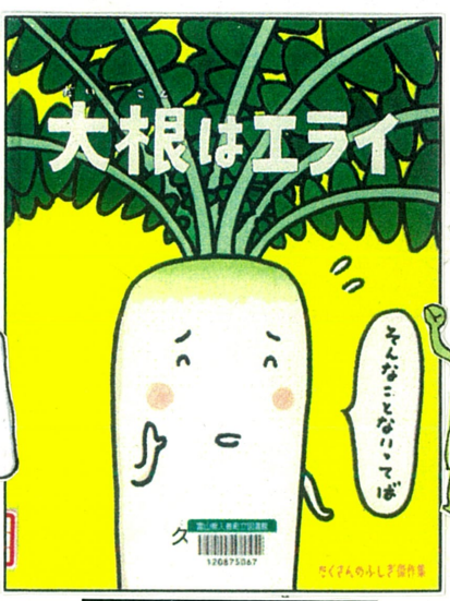
だいこん 大根はエライ (久住昌之 文・絵、福音館書店)