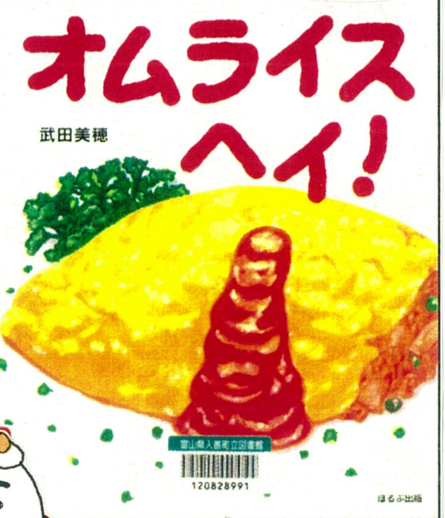
オムライス・ハイ! (武田美穂 作、ほるぷ出版)