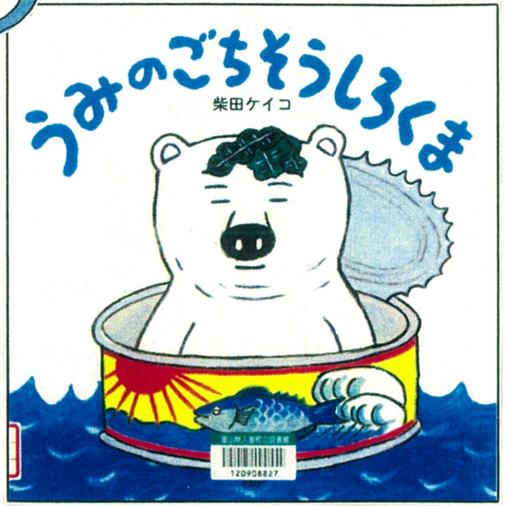
うみのごちそうしるくま (柴田ケイコ 作・絵、PHP研究所)