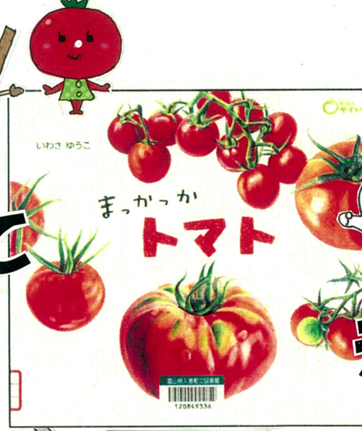
まっかっか トマト (いけさゆうこ 作、童心社)