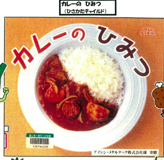
カレーのひみつ (ひさかたチャイルド)