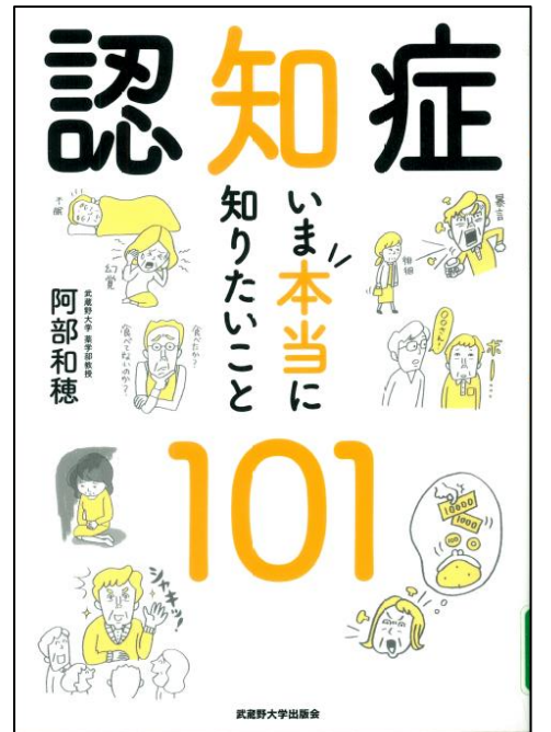
『認知症 いま本当に知りたいこと101』 (阿部和穂、武蔵野大学出版会)