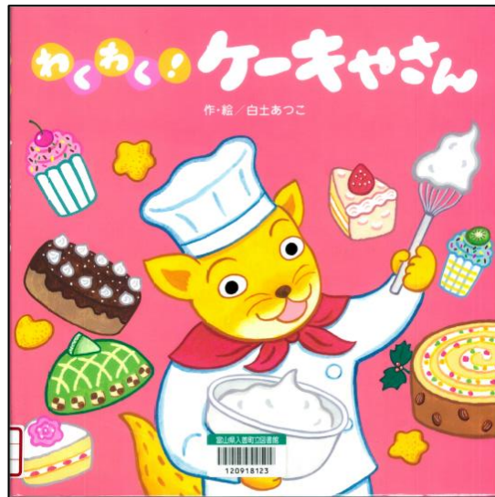
『わくわく！ケーキ屋さん』 (白土あつこ・作/絵、ひさかたチャイルド)