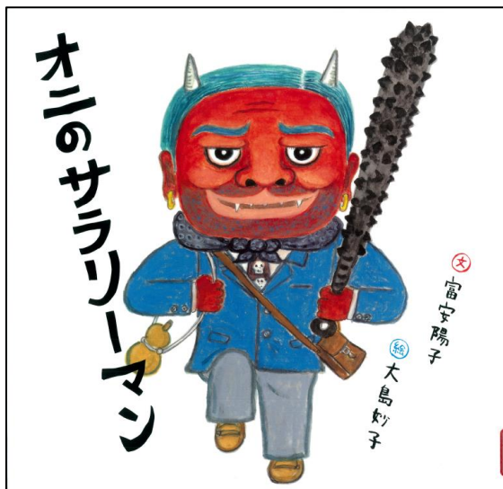
『オニのサラリーマン』 (富安陽子・文、大島妙子・絵、福音館書店)

今月は色々な仕事の本を集めました。大きくなったらなってみたいものを、ぜひさがしてみてくださいね！