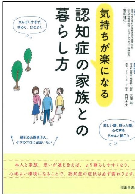
『気持ちが楽になる 認知症の家族との暮らし方』 (繁田雅弘・監修、池田書店)