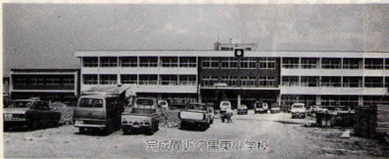
完成間近の黒東小学校

地方税法の改正に基づくもので国民健康保険税の課税限度額の引き上げ及び低所得者減額の対象所得基準額の引き上げである。