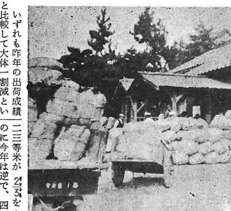
出荷最盛期における農機前の頃の山