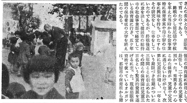
その後招かれて出陣隊都らた記念品である。その都らた記念品である。その都らた記念品である。

元、精進といふのは、固執の意にも、放散の意にも、行儀におきかて、この精神を打込んで、修行すること、精進である。