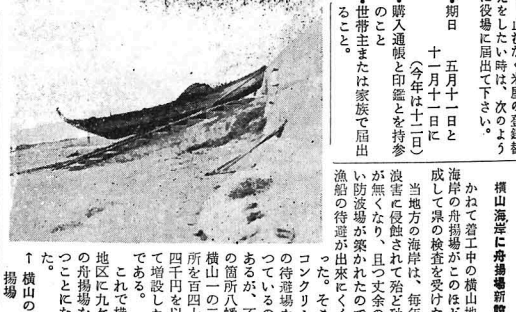
横山海洋に特産魚新設... 横山海洋に特産魚新設... 横山海洋に特産魚新設...