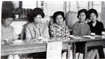
衛生協力委員 婦人会の受付スナツプ