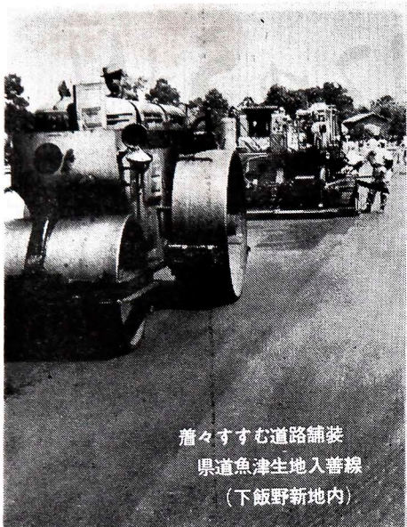
着々すすむ道路舗装 県道魚津生地入善線 (下飯野新地内)