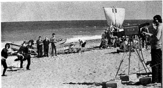
吉原海岸での録画風景 (19日)