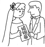
婚姻届けをしない正式の夫婦として認められませんか

ものです。そこでこの必要に応じて、人の身分関係を登録してこれを一般に証明する制度として設けられたものが戸籍制度です。またわが国においては、婚姻や養子縁組は事実上夫婦となり親子となるだけではもちろん、結婚式や縁組の式を挙げて法律上の夫婦や親子とはなりません。市区町村役場に婚姻の届出や養子縁組の届出をすることによって、法律上の夫婦や親子となるのです。すなわちこの場合には、身分の変動が戸籍制度上の届出と結合されているわけです。また日本人である以上は戸