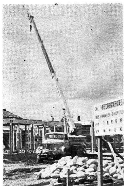
(南部保育所建築工事)

第十七回入善町議会定例会は去る九月二十九日、三十日の両日議場で開かれ老人医療費や心身障害者医療費の助成に関する条例などを審議可決し、請願十五件、陳情八件を採択しました。また十月八日で任期の満了する助役と教育委員会委員一名および十月九日より欠員になる収入役の選任に対しての同意などもありました。以下は九月定例会議会における主な審議状況です。