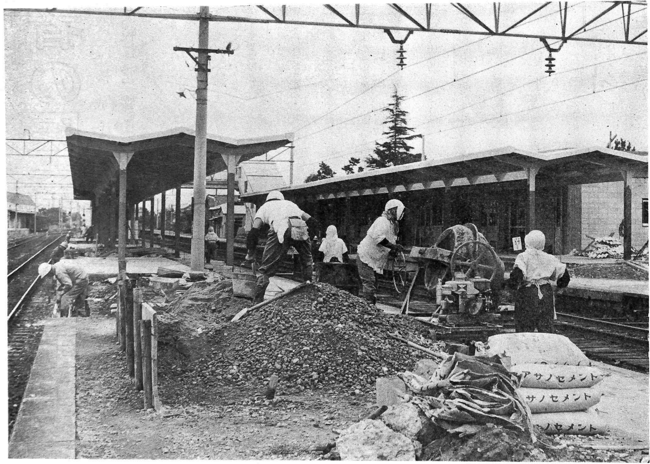
写真は入善駅ホームの改良工事現場

▽：新駅舎で営業予定の十二月一日には、町でも盛大な祝賀行事を計画する一方、急行列車などの停車本数の増加に躍起となっています。しかしながら、入善駅の営業実績がものをいう現時点では、「国鉄のすべての切符は入善駅で」という小さな心がけと実践こそ、この目的達成への唯一の方法といえそうです。