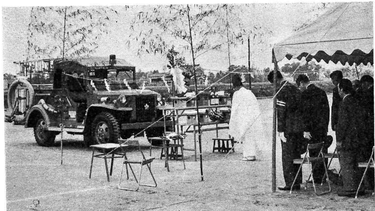
栲山小学校々庭での入魂式 (十月四日)