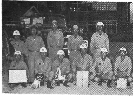
5位入賞をはたした横山消防分団