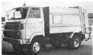
3.25トン積みと1まわり大型化