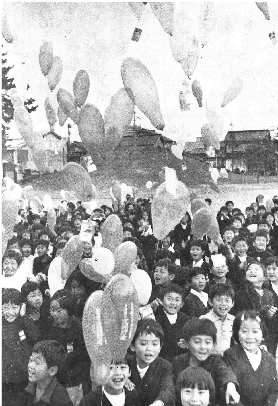
柏崎市などから礼状