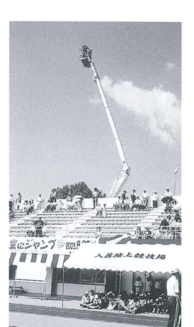
消防はしご車を 使って、高さ22 粒の上空から人 文字を撮影