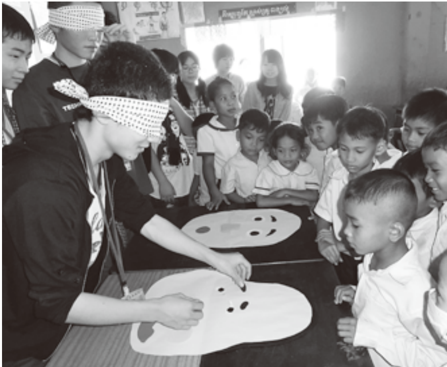
日本の遊びに興味津々なカンボジアの子どもたち