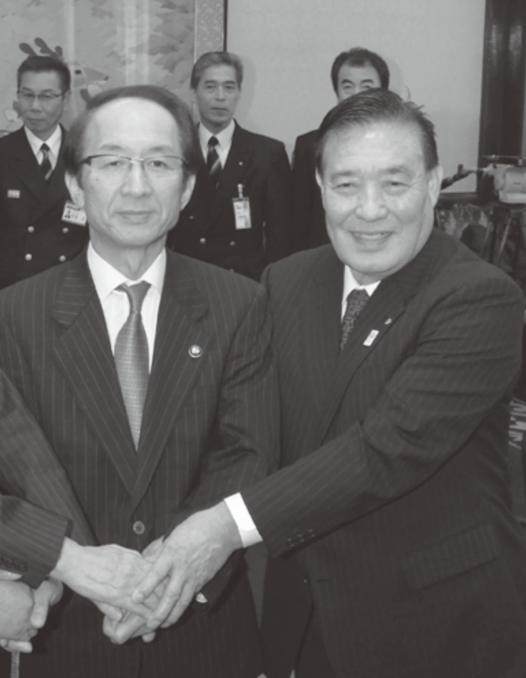
がっちり握手を交わし、連携を確認する町長ら=2月8日、県庁特別室

黒部市、入善町、朝日町の消防事務を取り扱う一部事務組合「新川地域消防組合」が2月8日に発足しました。3月30日から1市2町の消防・救急業務が共同化され、消防の新体制が始まります。