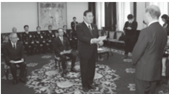
知事から許可書を受け取り、決意を述べる町長(中央)

式では、知事が「さまざまな災害に備え、消防活動に取り組んでください」とあいさつし、米澤町長が代表して、「1市2町の消防力が結集されるが、単純な足し算ではなく、何倍もの強化につなげて住民の期待に応えます」と決意を述べました。