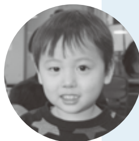
写真は2歳児歯科健診、3歳児フッ素塗布に集まったよい子たち