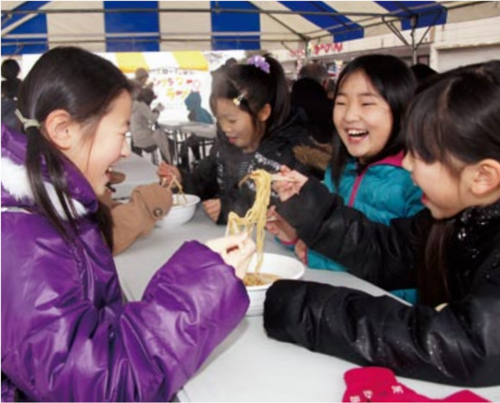
熱々のラーメンに笑顔がこぼれる。2月9日、うるおい館前