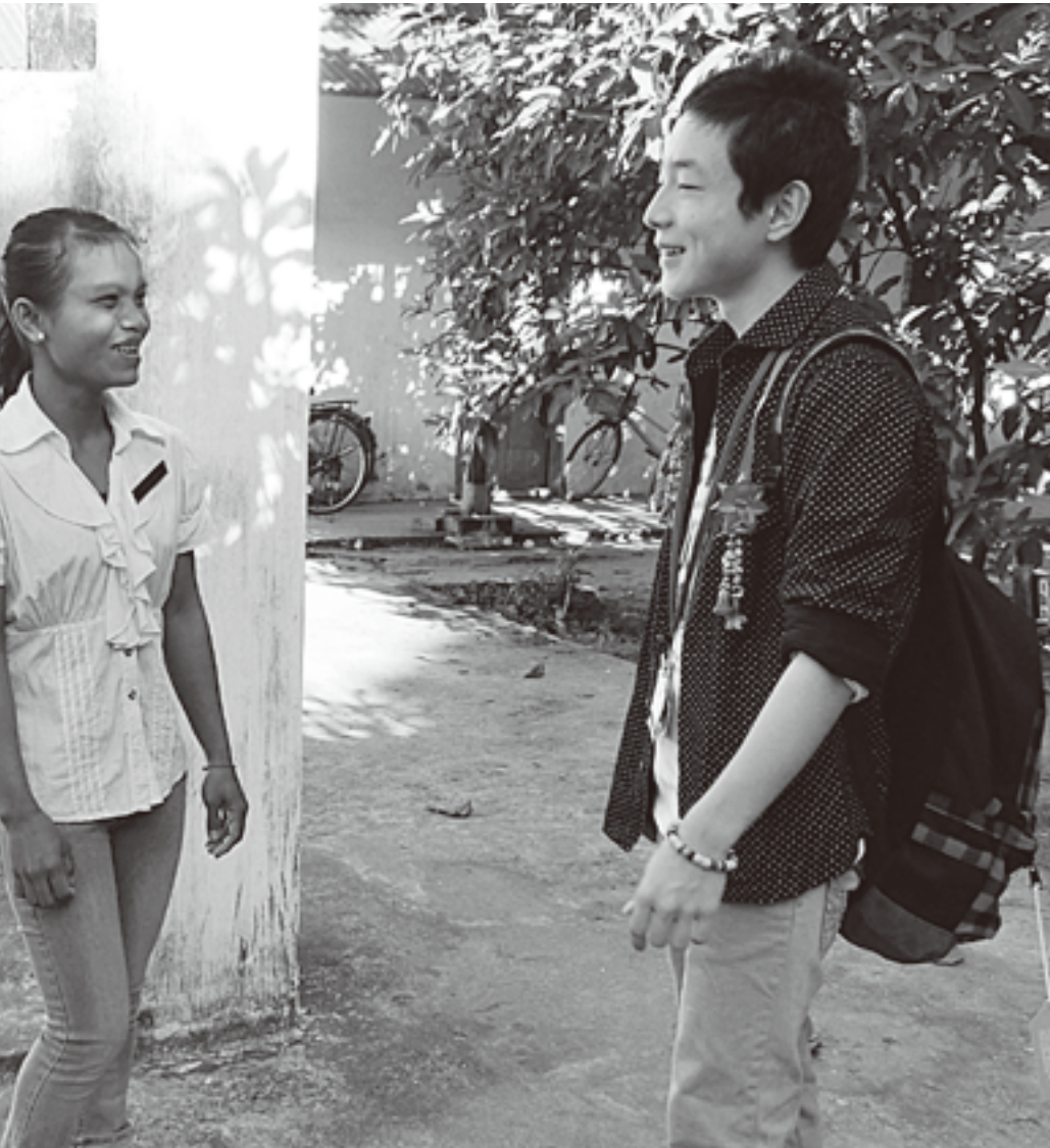
カンボジアの人たちは、どんなときでも笑顔で迎えてくれました=山本学校で