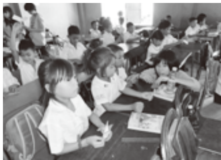
折り紙遊びも熱心に取り組んでくれました