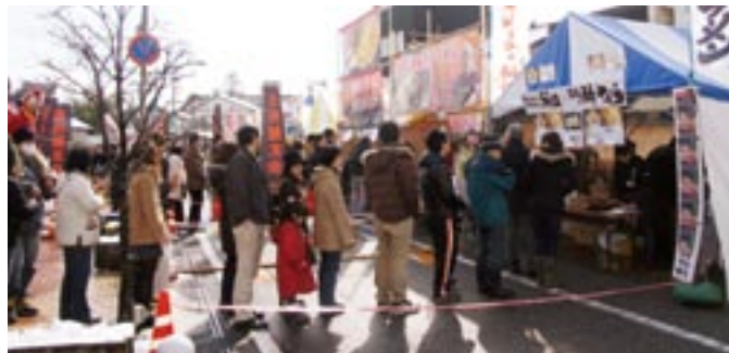
県外の有名店には1時間以上並び店も