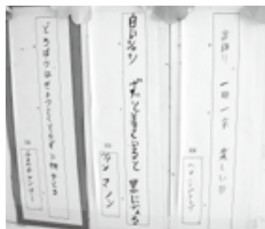
山本学校で見た句

ずっと着ていると 黒になる」という句がありました。貧しさで身の不自由にとらわれていても、現実を認め、前に進んでいこうという明るい希望が感じられました。