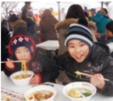
「どっちがおいしい?」と食べ比べ