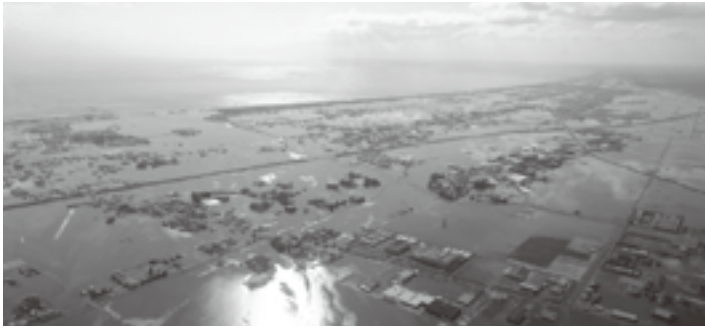
巨大津波がまちをのんだ東日本大震災

気象庁が発表する津波警報が3月7日から変わります。津波警報は皆さんの命を守る大切な情報です。変更点を知り、いざというときは自ら避難して命を守ってください。 ■主な変更点 ①予想される津波の高さを「巨大」「高い」と表します 津波警報と同時に発表する「予想される津波の高さ」は、3層など具体的な数値を使わず、「巨大」「高い」という言葉で表現します。特に、巨大という大津波警報が出るときは、東日本大震災のような巨大津波が来るおそれがあります。直ちに高台などの安全な