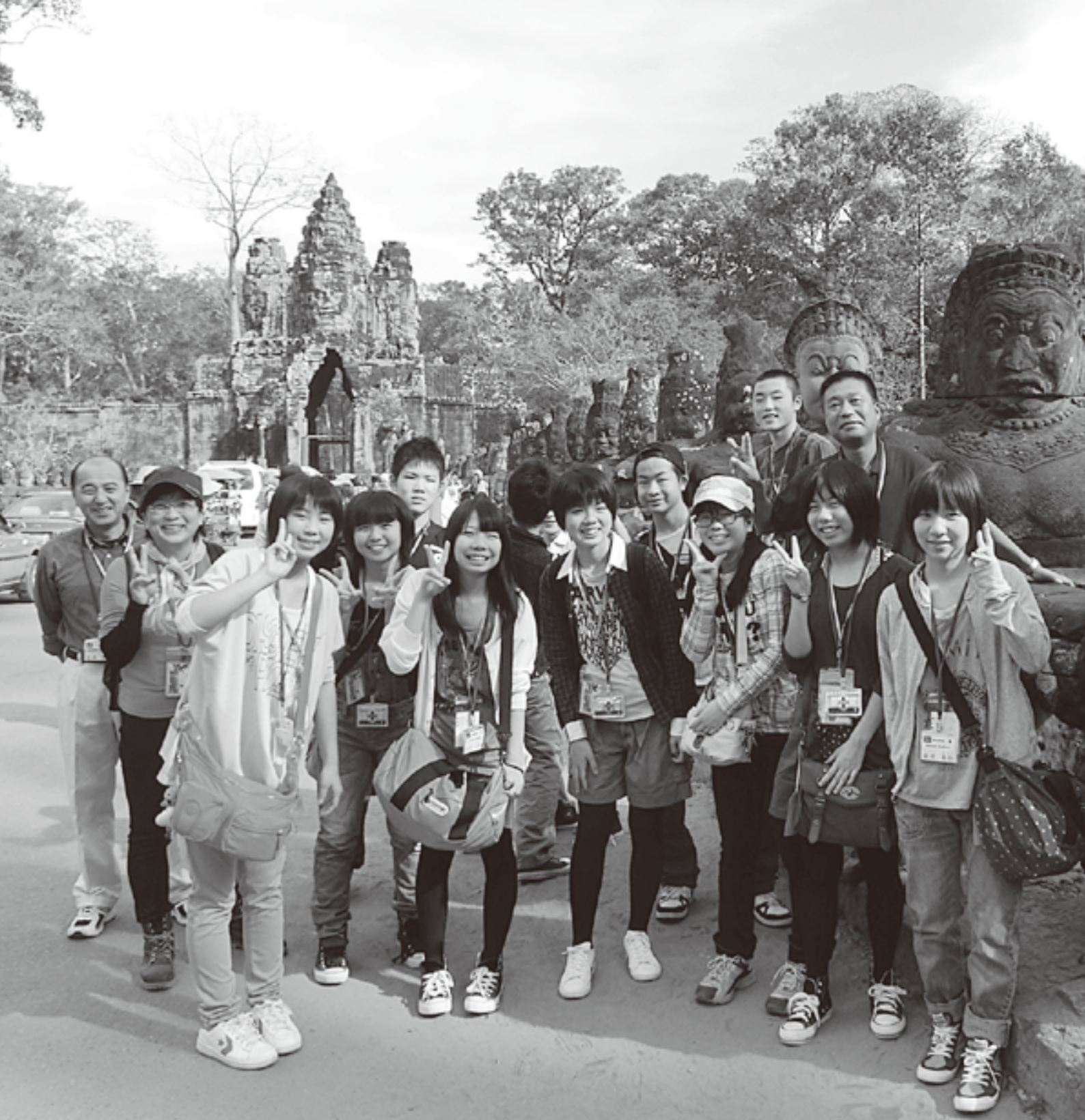
カンボジアの歴史や生活文化に直接触れ、さまざまなことを学んだ生徒たち=アンコール・トムの南大門で