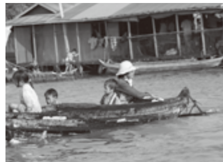
きょうを生きるために働く水上生活の家族