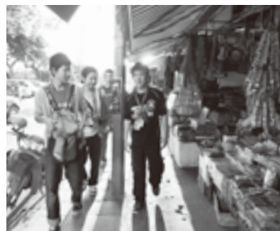
土産物が並ぶオールドマーケット

「その場でお金をあげればいい」と考える人もいるかもしれませんが、でも僕は、そのようなことで解決してもあまり意味がないと思います。