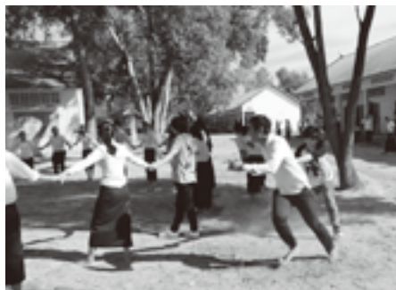
遊びも一生懸命。カンボジアの追いかけっこ