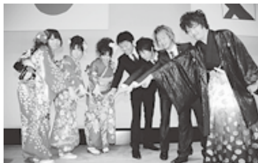
△新しい出会いが広がる実行委員会

町は、来年1月12日(日)に開く成人式の企画や運営をする、新成人の皆さんを募集しています。あなたも実行委員となり、思い出に残る式典