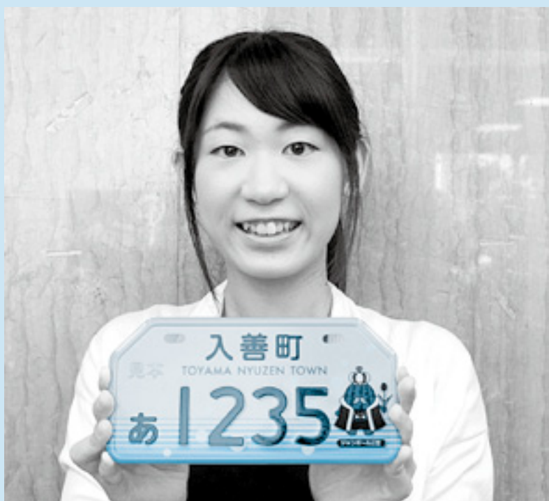
△オリジナルナンバープレートは水の町をイメージしています

町は10月1日（火）に合併60周年を迎えます。記念すべき節目を飾る、さまざまな町の事業の一部をここでご紹介します。多くの皆さんにご参加いただき、一緒に町を盛り上げましょう。