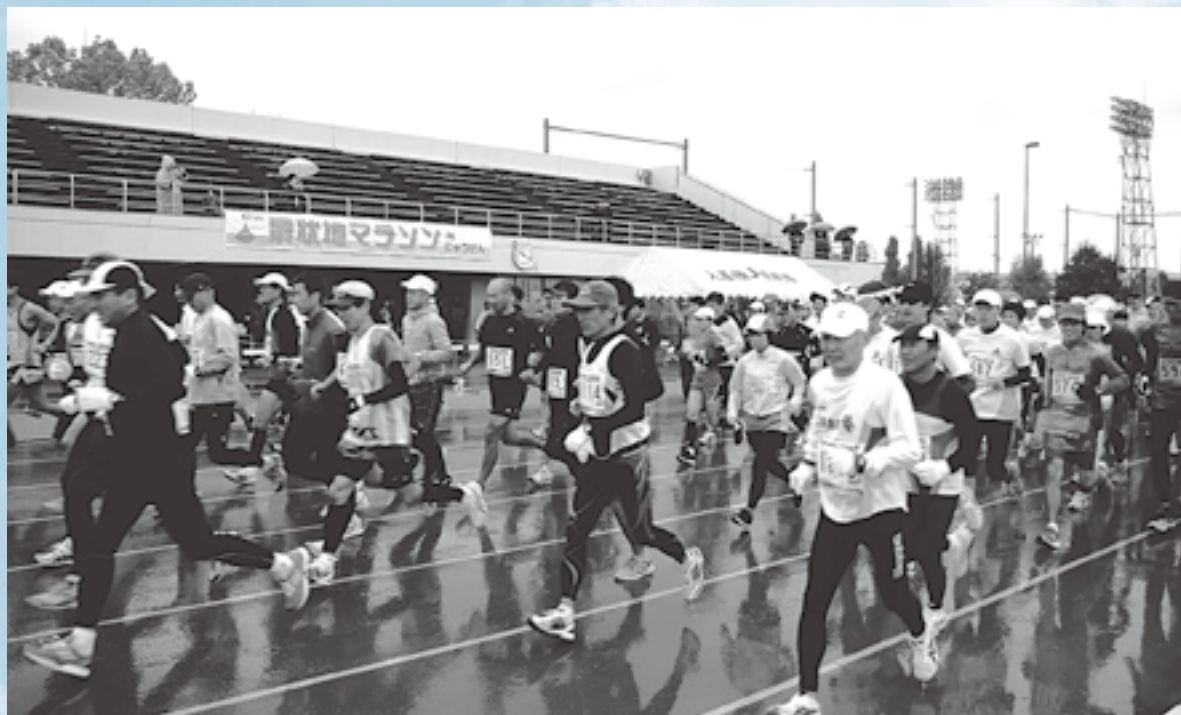
△昨年は過去最多1,906人がエントリー＝昨年の扇状地マラソンのスタート