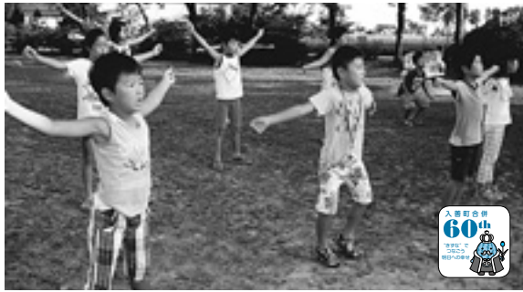
△夏休み期間に体操を覚える児童

町では合併60周年を記念して「平成25年度特別巡回ラジオ体操・みんなの体操会」を