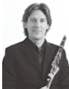
◀ポール・メイエ (クラリネット)