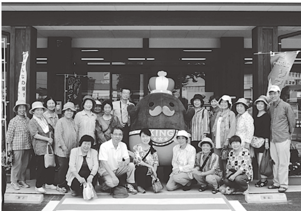
ジャンボ〜ル三世と記念撮影＝みな穂あいさい広場

変わりゆく町の姿の見学を通して町政への理解を深める「町政バスツアー」は7月30日に行われ、公募で参加した60代から70代までの21人が、町内の各施設をバスで巡り、新しい町の魅力を肌で感じ取りました。