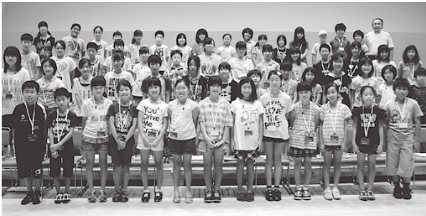
△本番と同じコスモホールの舞台で練習するジュニア・コーラス・メンバーの皆さん＝演奏会の情報は11頁に記載。

ここは、みんなでつくるページです。情報をお寄せください。秘書政策係 ☎72-1100 内線201