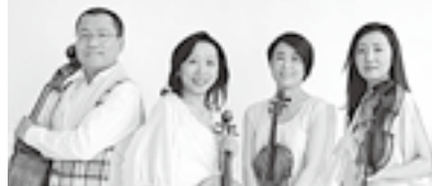
▼クアルテット・エクセルシオ (弦楽四重奏)