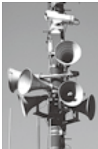
緊急情報を伝える防災行政無線

町は、地震や津波、武力攻撃などの緊急事態の発生に備え、Jアラート（全国瞬時警報システム）を整備しています。これは、国からの緊急情報を迅速に皆さんにお伝えするため、防災行政無線を自動操作するシステムです。 次の日程で、Jアラートの全国一斉試験放送が行われます。当日は、防災行政無線の屋外スピーカーや家庭用戸別受信機、防災行政ラジオで、2回の放送が鳴ります。