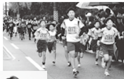
△部活の練習の成果を競い合う＝昨年の扇状地マラソンの小学生3 キロ 。

■申し込み・問い合わせ 扇状地マラソン大会事務局(総合体育館内) 74-2500