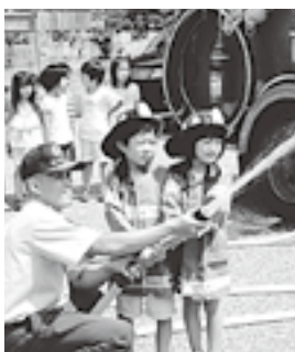
園児を対象に防火教室