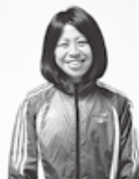
◁ゲストランナーの福士加代子選手