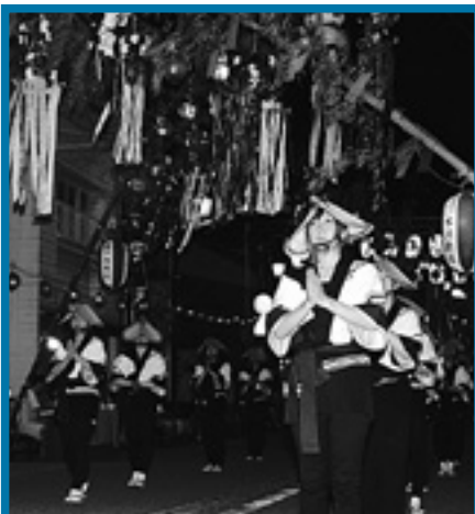
△昔ながらの踊りを長年続けてきたことが優勝の決め手となった＝商工会女性部