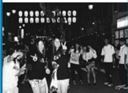
△中心街は出店に並ぶ人などでにぎわう

最終日の7日は「ふれあい入善音頭街流し競演会」があり、町内外から参加した23チーム、約320人が息のそろった踊りを披露。創立50周年を迎えた入善町商工会女性部が、記念すべき節目に優勝を果たしました。