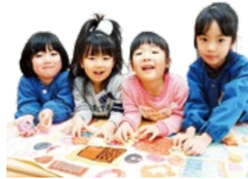
みんなで協力して作ったよ！ ＝さわすぎ保育所の園児たち

●「園児感想画展」を開催 町内保育所・幼稚園の園児たちが、絵本や物語を読んだ感想を造形作品に表しました。図書館内で展示しますので、ぜひご覧ください。 ■会期 2月6日(土)～25日(木)