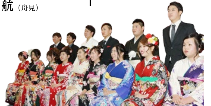
ひばり野小学校区の成人撮影

北星ゴム工業入善工場に勤務。実家暮らしなので、生活の多くを家族に甘えていたが、これからは家事を手伝いたい。