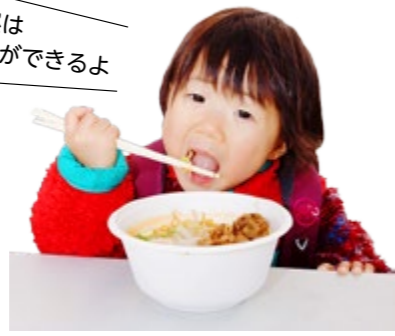
お昼は行列ができるよ

冬の市街地に、にぎわいを呼ぶ「第16回入善ラーメンまつり」が2月27、28の両日、うるおい館前の駐車場をメインに町全体で開催されます。