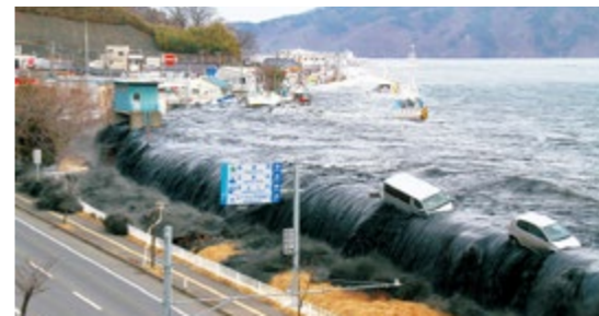
平成23年3月11日に発生した東日本大震災(岩手県宮古市提供)

町では、東日本大震災に関わった講師2人を招き、「防災講演会」を開催します。災害はいつ、どこで、どのような形で起こるか分かりません。講演会をきっかけに日頃の備えを考えてみませんか。予約不要で、入場無料です。