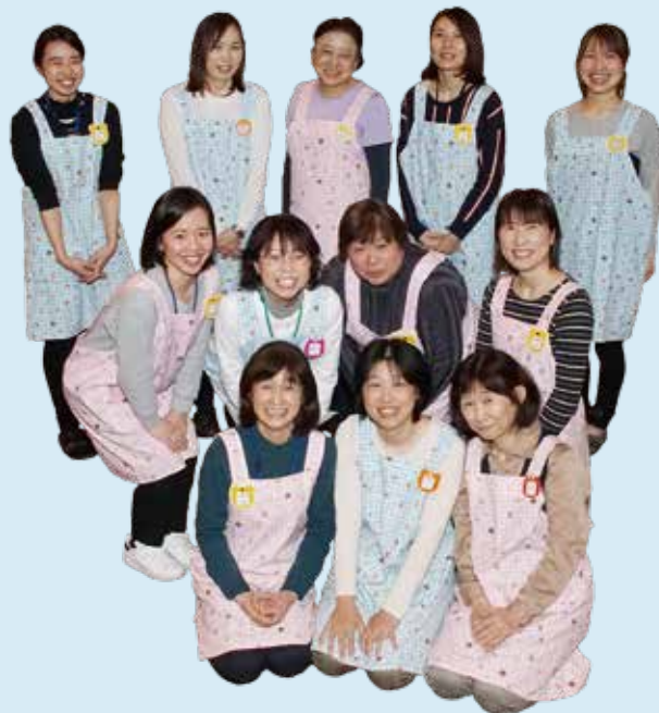
▲元気わくわく健康課 保健センターの職員