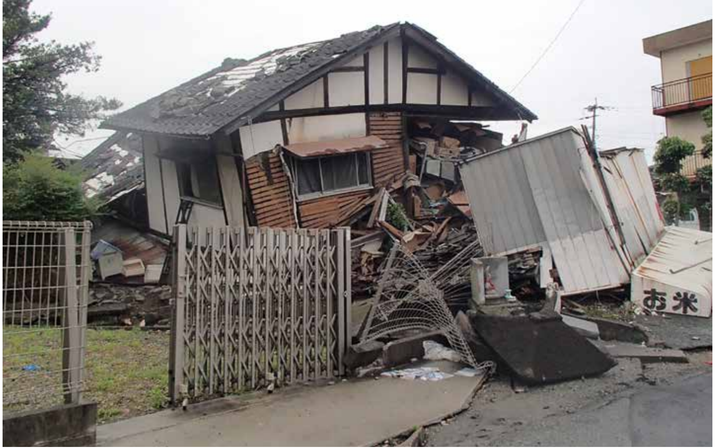
▲熊本地震で倒壊した住宅