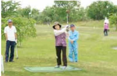
様々な種目にチャレンジしてください