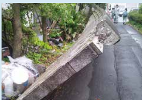
◀地震で倒壊したブロック塀

■お問い合わせ とやま住まい情報ネットワーク住宅相談所 ☎076(441)6312