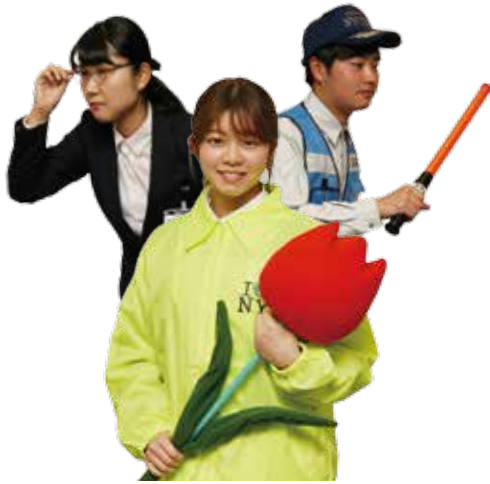
▲本年度採用職員も配属先で活躍中

~平成12年4月1日生まれの人で、栄養士免許または調理師免許のいずれかを持っているか、来年3月末までに栄養士免許を取得見込みの人。調理師免許を持っていない場合は、採用後に取得する必要があります。