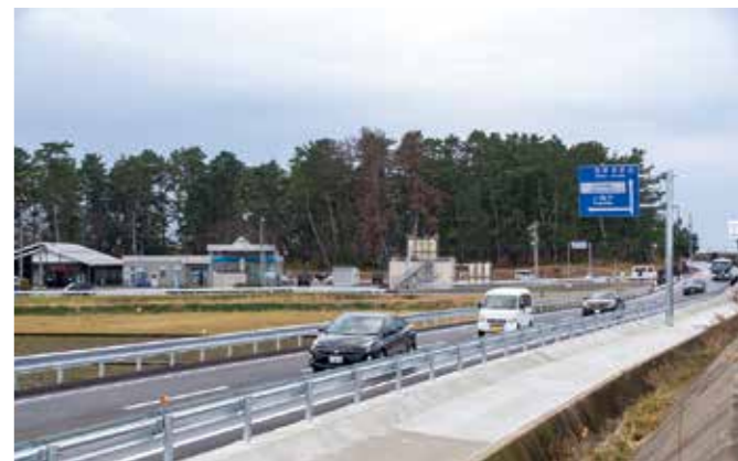
▲海洋深層水パークから園家山キャンプ場方面に向かう車

編集室 今月の表紙は成人式での一場面。タイムカプセルを開き、懐かしい品に顔をほころばせる新成人の皆さんの楽しそうな様子に、成人から12年経つ私はうらやましく感じました ▼毎月の表紙の写真は、悩みどころの一つ。今月号も、いくつか候補を挙げて撮影に挑むも、雪で行事が中止、カメラに水がかかって失敗となかなかもくろみどおりにいかず ▼撮りやすいはずの小学校の書初め大会では、フラッシュの強すぎる写真に。遅ればせながら、ことしの目標は「下手な鉄砲も数打ち当たる」方式の撮影から抜け出せるよう、精進することに決定です (良い写真をとらないと川感)