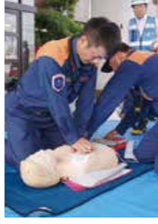
▲消防士が実技指導