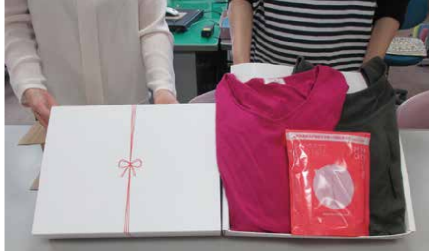
▲授乳服(マタニティ兼用授乳下着、キャミソール、上着)