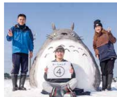
▲前回の最優秀作品

雪像をつくらう 第5回舟見雪まつり 冬の舟見の恒例イベント、「舟見雪まつり」をことしも開催します。今回は、雪像づくり大会を開催。参加賞のほか、上位入賞チームには景品もありますので、ふるってご参加下さい。 ■日時 2月5日(土)午前10時～午後1時(受け付けは午前9時30分)