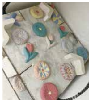
▲思い思いの色で絵付けした箸置き