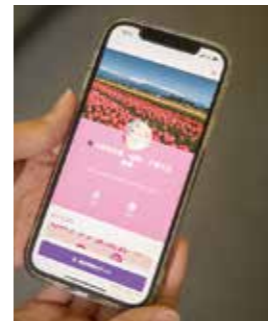
▲町の婚活情報をスマホで入手