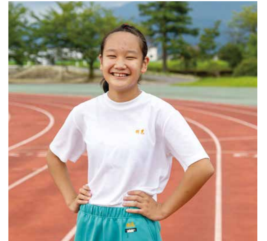
▲80mハードルで12秒台、走り高跳びで1m40cmが目標と話す羽黒さん