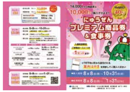
▲今月号と一緒に配布するチラシをご覧ください

町 では、新型コロナウイルス感染症の影響を受けている町内の店舗を応援し、町全体を元気にするため、お得な「にゅうぜんプレミアム商品券&食事券」を発行します。 購入に必要な「案内はがき」は7月下旬に全世帯に送付します。