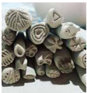
▲沢スギ内の植物スタンプを作成