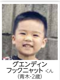
グエンディン フックニャットくん (青木2歳)