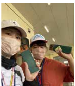
▲セリ体験をする文絵さん

■お願い 文絵さんは業務の都合で、工房見学や陶芸指導は受け付けていません。ご理解をお願いします。