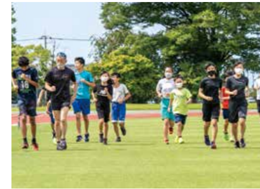
▲入善・朝日の仲間と練習に励む