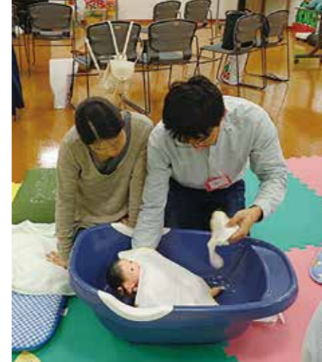
▲教室で、沐浴の練習

▷体験学習(妊婦体験、沐浴体験、だっこ練習) ▷ママのメンタルヘルスについて 持ち物 母子健康手帳 申込 開催3日前までに電話申込 申込・問い合わせ先 元気わくわく健康課 保健センター ☎72-0343