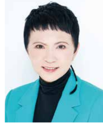
作家・僧侶 家田 莊子 さん

1時30分～(午後1時開場) ■場所 町民会館コスモホール ■内容 3部構成 ①生涯学習推進功労表彰 生涯学習の推進を通して、地域発展に貢献、公共福祉の増進に寄与した個人・団体を表彰します。 ②男女共同参画推進員による発表 ロールプレイを通して、男女共同参画について考えます。 ③基調講演 「一緒に生きて行こう」あなた