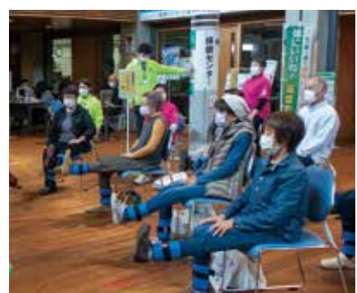
▲昨年の会場での様子

健康と福祉の祭典、「サンウェルdeフェスタ2022」を開催します。 ことしのテーマは「より良い睡眠でココロとカラダを健康に」。会場では、楽しく健康になれるコーナーが盛りだくさんです。家族や友人おそろいでサンウェルへお越しください。 ■日時 8月27日(土) 午前9時～正午 ■場所 サンウェル