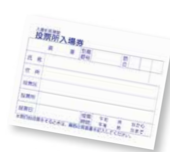
▲入場券は世帯ごとに配布します

有権者には、事前に投票所入場券を配布します。投票日には入場券を持参して、同券に記載されている各地区の投票所で投票してください。入場券を紛失したときは、身分を証明できるもの(運転免許証など)を持参