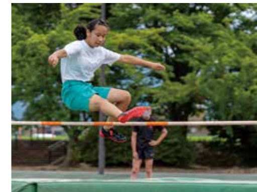
▲歩数やステップを確かめながらジャンプ