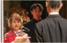
▲実行委員が決意を述べる

20歳を祝う記念式典の 実行委員を募集 町では、今年度20歳を迎える人で、20歳を祝う記念式典の企画や運営をする実行委員を募集します。 あなたも実行委員として、思い出に残る式典を自分たちの手でつくってみませんか。 式典には、学業などの都合で町外に転居した人も参加できます。参加を希望する人は、左記へ連絡ください。 ■ 募集期限 8月31日(水) ■ 募集人数 6人程度 ■ 申込・問い合わせ 教育委員会事務局 生涯学習・スポーツ課