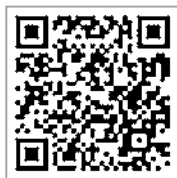
▲マイナポイント ホームページ

マイナンバーカードは、本人確認書類として使える公的な身分証明書。 9月末までにカードを申請した人が、所定の手続きをすると、キャッシュレス決済に使えるポイントを最大 20,000 円分もらえる「マイナポイント」事業も実施中です。(ポイントの申込期限は令和5年2月末まで) この機会にぜひカードを取得しましょう。