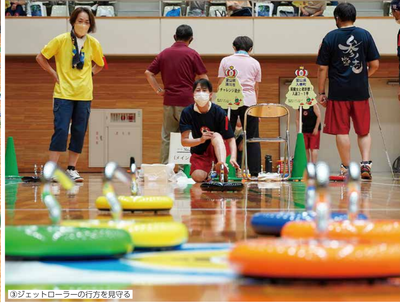
③ジェットローラーの行方を見守る