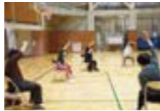
▲気軽に参加できます

町では、足腰に不安がある人を対象に、筋力アップ体操やストレッチをする教室を開催します。参加を希望する人は、9月16日（金）までに下記へ申し込みください。 ■対象 町に住む65歳以上の人で、足腰に不安のある人 ■定員 20人程度 ■日時 9月29日～12月22日の毎週木曜日（祝日除く）