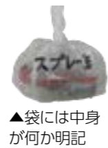
▲袋には中身が何か明記

中身の入ったスプレー缶やカセットボンベなどがそのまま出されたことが原因で、ごみ収集、処理中に爆発・火災事故が発生しています。 ごみを出す時は必ずルーラーを守りましょう。スプレー缶、カセットボンベ、ライターは中身を使い切った上で（缶やかセットボンベには穴を開ける）レジ袋などに入れ、燃やせないごみ（金属、ガラス、粗大ごみ類）の日に出示してください。 ■問い合わせ 住民環境課 生活環境係 72-11824