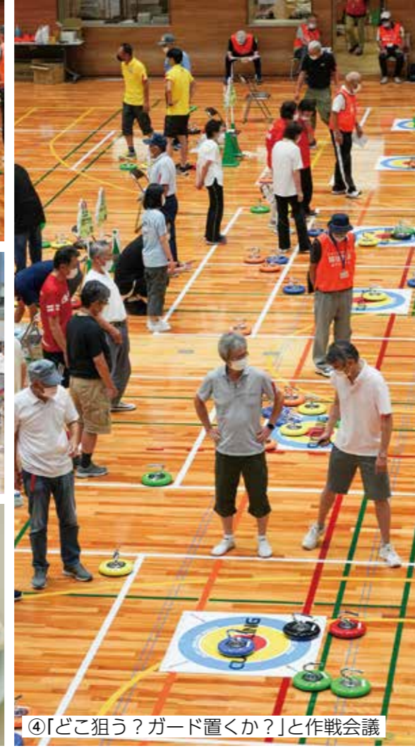
④「どこ狙う？ガード置くか？」と作戦会議