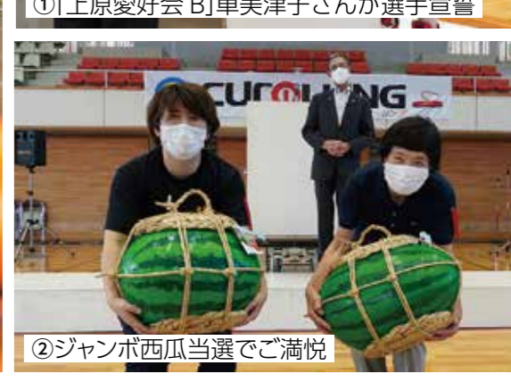
②ジャンボ西瓜当選でご満悦