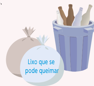
✗ Mau exemplo