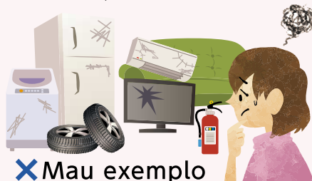
✗ Mau exemplo

O morador do bairro responsável pelo turno para administrar o local designado de descartar o lixo, custa muito trabalho em ordená-lo quando o lixo não está classificado corretamente ou é descartado no dia da coleta errada.