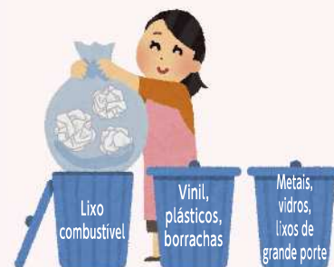
○ Bom exemplo

Obedecer às normas acima citadas e utilizar o local designado de descartar em forma agradável.