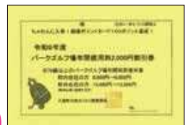
令和9年度 パークゴルフ場年間使用料割引券

お申し込み・お問い合わせ 入善町元気わくわく健康課 保健センター ☎72-0343