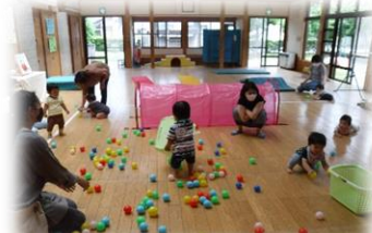
びよびよ・わんわんサークル